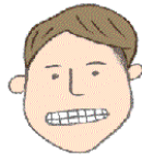
②いー と口を大きく横 に広げる