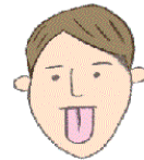
④べー と舌を下に 突き出す