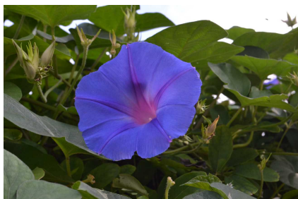
(幼稚園で咲くアサガオ)