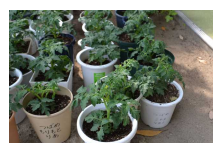
年中さん(ミニトマト)

*植木鉢は、個別面談後、持ち帰っていただくお知らせをしましたが、野菜の成長が早いため、6月11日(土)の保育参観日に持ち帰っていただきます。