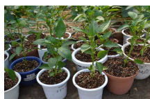
年長さん(ピーマン)