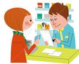
コンビニでお支払い