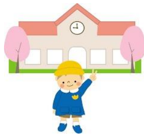
幼稚園で商品を受け取り